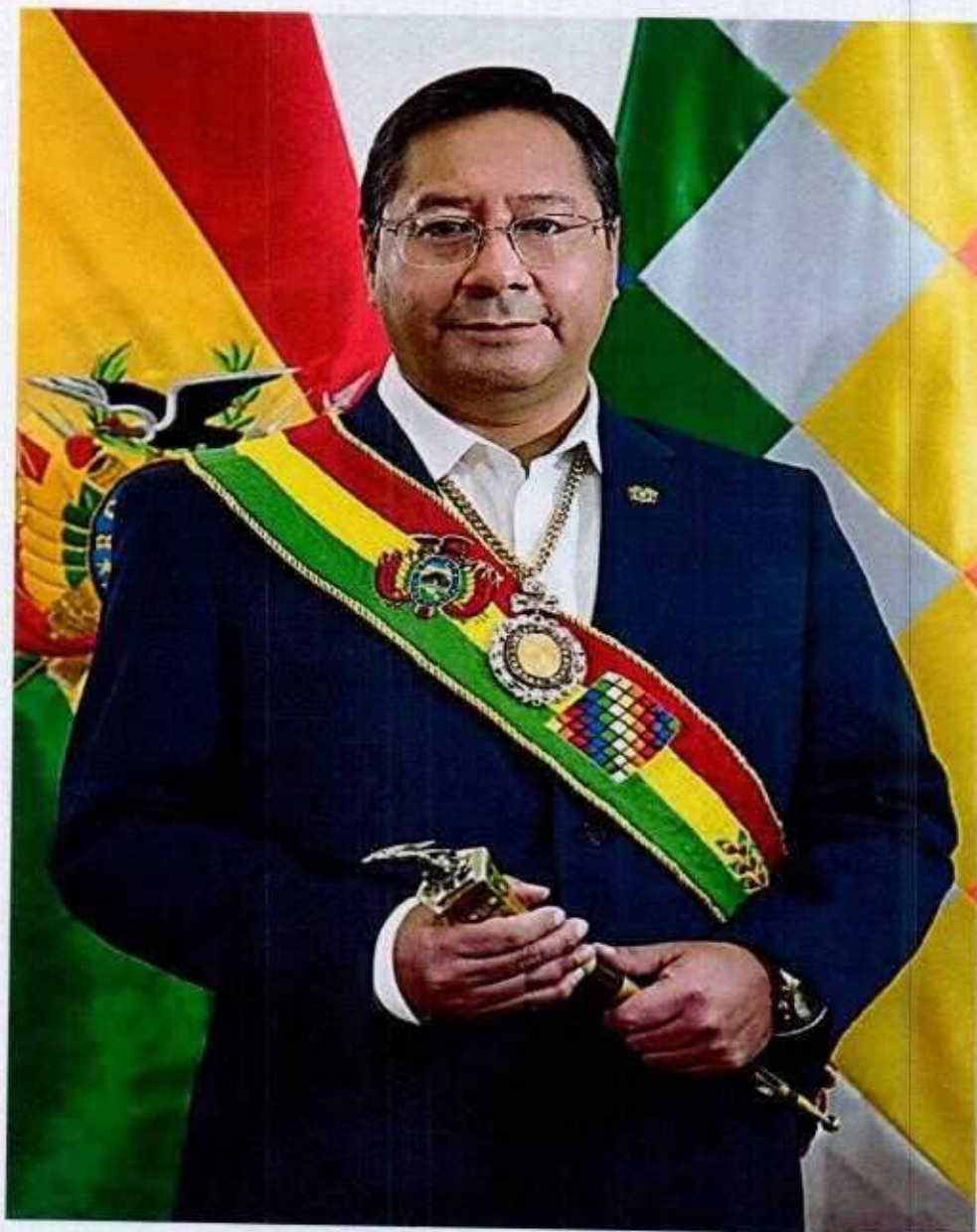
LUIS ALBERTO ARCE CATACTORA PRESIDENTE ESTADO PLURINACIONAL DE BOLIVIA