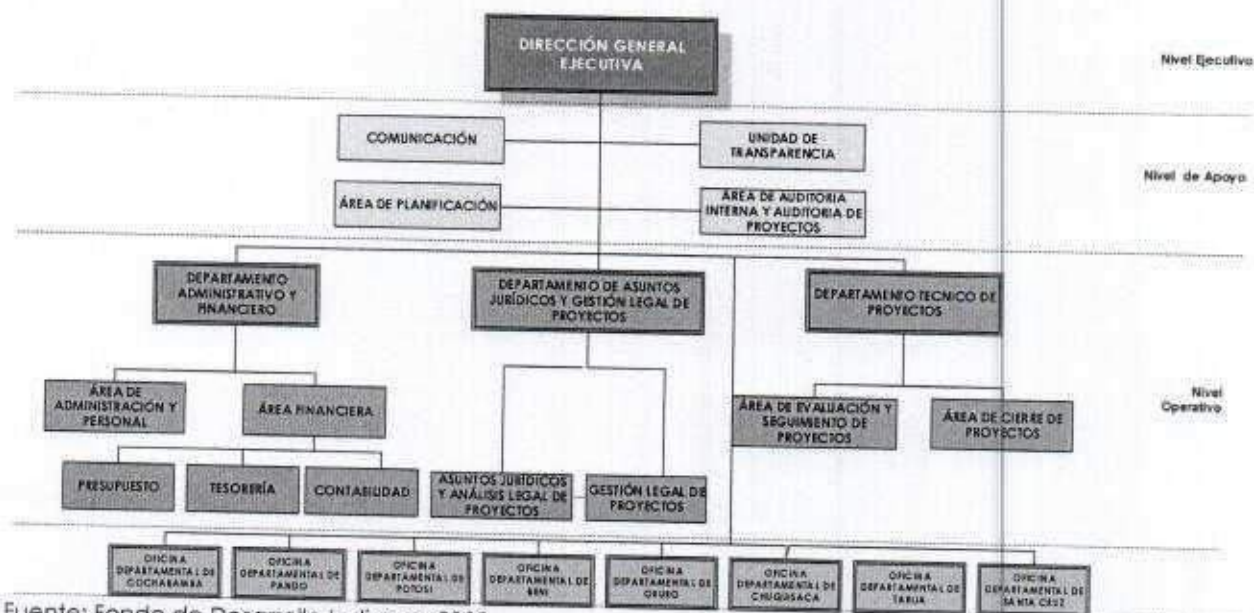
GRAFICO 2 ORGANIGRAMA DEL FONDO DE DESARROLLO INDÍGENA RESOLUCIÓN ADMINISTRATIVA FDI/ N° 055/2021